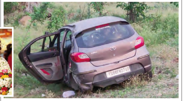
ప్రమాదానికి కారణమైన కారు, ప్రమాదంలో మృతి చెందిన కరుణ(డైలీ)