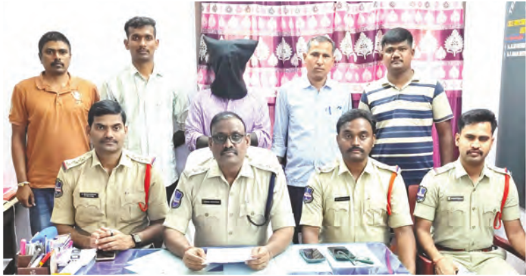
దండేపల్లి, ఏప్రిల్ 21