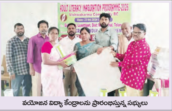
వయోజన విద్యా కేంద్రాలను ప్రారంభిస్తున్న సభ్యులు