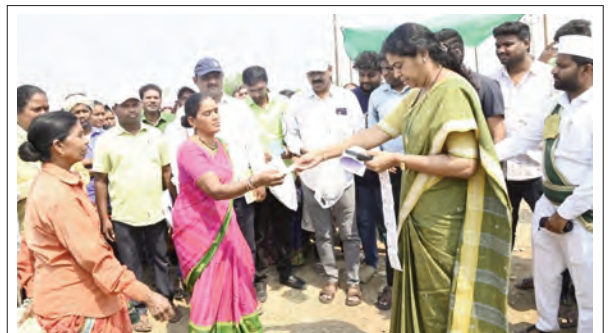
ఉపాధిహామీ కూలీలకు ఓఆర్ఎస్ ప్యాకెట్లు అందజేస్తున్న జిల్లా కలెక్టర్

సౌకర్యాలు తప్పనిసరిగా అందుబాటులో ఉండాలని ఆదేశించారు. ఇటీవలి రోజులుగా ఉష్ణోగ్రతలు ఒక్కసారిగా పెరిగిన నేపథ్యంలో వేడి గాలుల ప్రభావం ఎక్కువగా ఉండే అవకాశం ఉందని, ప్రజలు ముఖ్యంగా ఉపాధి కూలీలు ఆరోగ్యంపై ప్రత్యేక శ్రద్ధ వహించాలని సూచించారు. అనంతరం కూలీలకు ఓఆర్ఎస్ ప్యాకెట్లు పంపిణీ చేశారు. ఈ కార్యక్రమంలో స్థానిక అధికారులు, ఈజీఎస్ సిబ్బంది, ఉపాధి హామీ కూలీలు తదితరులు పాల్గొన్నారు.