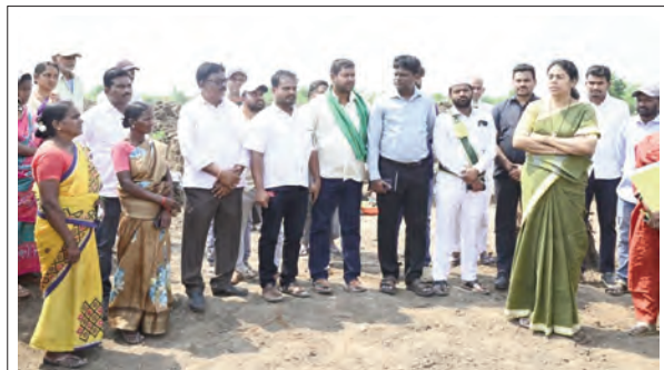
ఉపాధిహామీ కూలీలతో మాట్లాడుతున్న జిల్లా కలెక్టర్ హరిత

- ఉపాధి కూలీలకు జిల్లా కలెక్టర్ హరిత సూచనలు