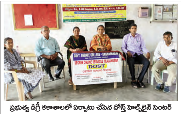
ప్రభుత్వ డిగ్రీ కళాశాలలో ఏర్పాటు చేసిన డోస్ట్ హెల్ప్లైన్ సెంటర్