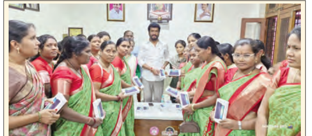
అంగన్వాడీ టీచర్లకు స్టార్ట్ ఫోన్లను పంపిణీ చేస్తున్న ఎమ్మెల్యే అనిల్ జాదవ్