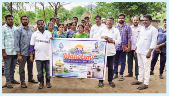
అవగాహన ర్యాలీ నిర్వహిస్తున్న అధికారులు, ప్రజాప్రతినిధులు